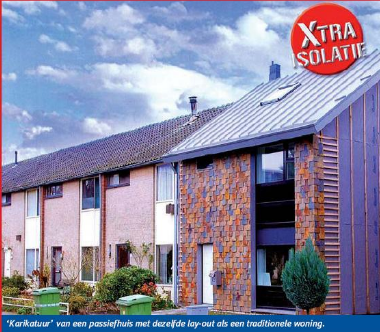
'Karikatuur' van een passiefhuis met dezelfde lay-out als een traditionele woning.

Uit energetisch oogpunt biedt een luchtdichte en goed geïsoleerde gebouwschil voordelen. Het energetisch voordeel van passiefhuizen lijkt nadelig voor de brandveiligheid. Er gaan zelfs geruchten dat een passiefhuisconcept brandonveilig is. Wat is het risico voor bewoners? En wat betekent het voor hulpverleners bij repressief optreden?